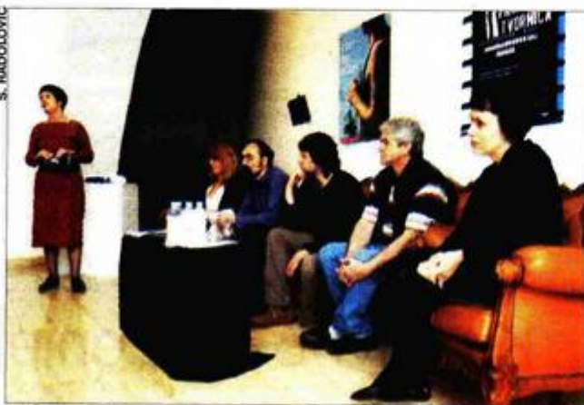
S konferencije za novinare Pulske filmske tvornice

Napomenuo je da je cilj Pulske filmske tvornice, koja od ožujka ove godine djeluje kao udruga, razvoj, unapređenje i promicanje filmskog i videostvaralaštva kao tehničke i umjetničke discipline, produkcija